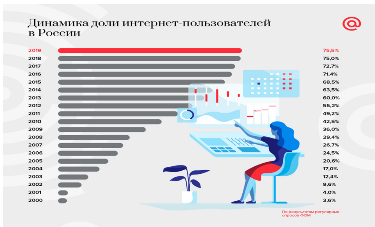
Рисунок 1. Динамика появления новых пользователей сети Интернет в России

стала намного ожесточеннее, чем была до появления всемирной сети. Методы получения желаемого, иначе говоря, захват власти, становятся с каждым разом все изощреннее.