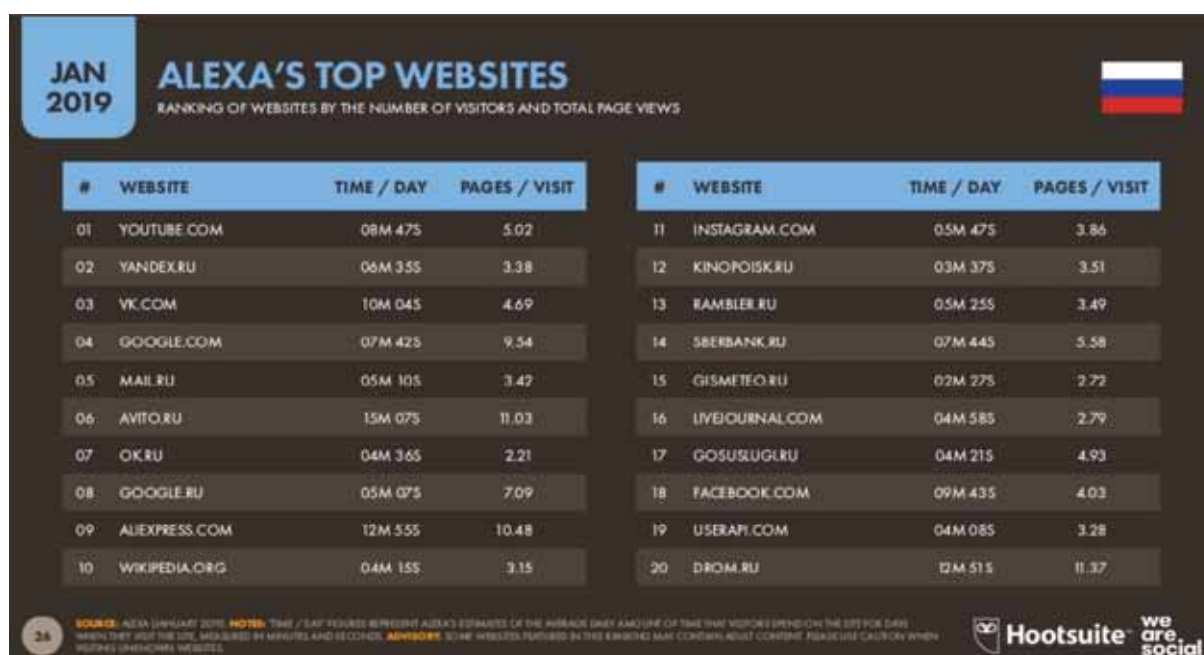
Рис.1. Список популярных сайтов в России, по данным Alexa на 2019 год.

Среди опрошенных россиян 63% пользуются YouTube, 61% ежедневно используют ВКонтакте. Про Facebook вспомнили 35% респондентов, а про Одноклассники – 42%. В России выходят в онлайн каждый день 85% людей, активно используют мобильный интернет 91,4 миллионов человек [9].